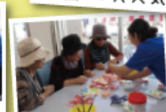
デコパージュセッけん