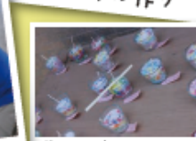
皆さんの作ったキャンドル