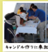
キャンドル作りに参加