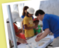
お子さんもチャレンジ!