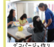
デコパージュ作り